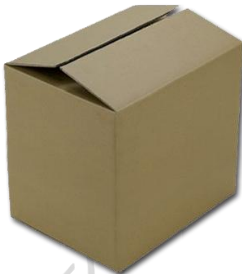
每箱：9 层*24=216 只传感器